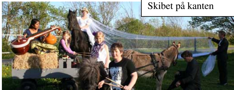
Skibet på kanten