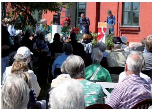
Knap 300 var samlet i Fyrhaven til Grundlovsfest