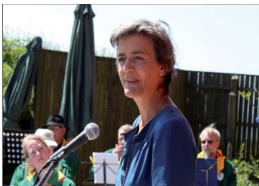
Margrethe Vestager holdt en fin grundlovstale

Bovbjerg Fyr kastede lys over Dyrskuets i Lemvig på en sådan måde, at ingen af de flere tusinde besøgende kunne undgå at blive grebet af kreativiteten, aktivitetsniveauet og indholdet i de oplevelser, Bovbjerg Fyr tilbyder året rundt. Mange nye støtte-medlemmer kom til og vi har nu passeret 500 støtte-medlemmer.