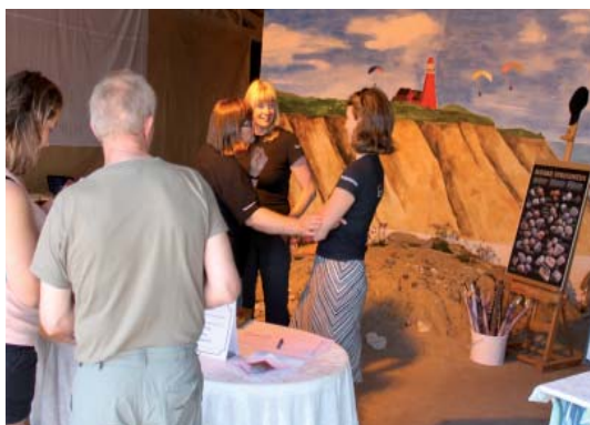
Standen blev flot indrettet og der var livligt besøg begge dage med snak og konkurrencer.