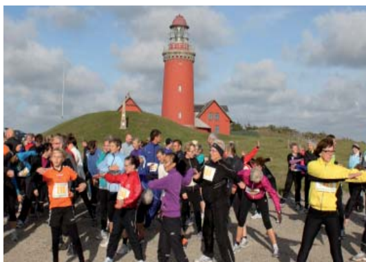
Festlig opvarmning til Bovbjergløbet