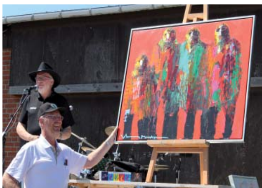
Auktionen på Johnny Madsen maleriet indbragte 44.000 kr. til Bovbjerg Fyr

Bovbjerg Fyr var repræsenteret med en stand på dyrskuet i Lemvig 4. og 5. juni 2011. Vi var inviteret, og vi fik en flot plads i den gamle hangar. Det var et fantastisk tilbud, som vi er glade og stolte over at vi kunne sige ja tak til.