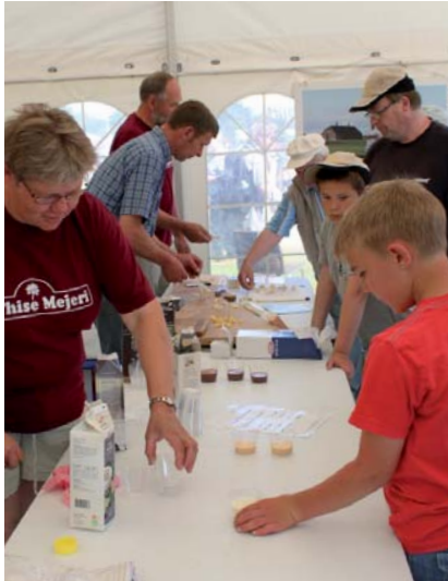
Thise Mejeri uddeler smagsprøver på dyrskuet.

og om tilblivelsen af netop deres kunst. De samme kunstnere skænkede desuden et værk til den kunstauktion, som om søndagen blev afholdt til fordel for Bovbjerg fyr. Overskuddet gik ubeskåret til Bovbjerg fyr.