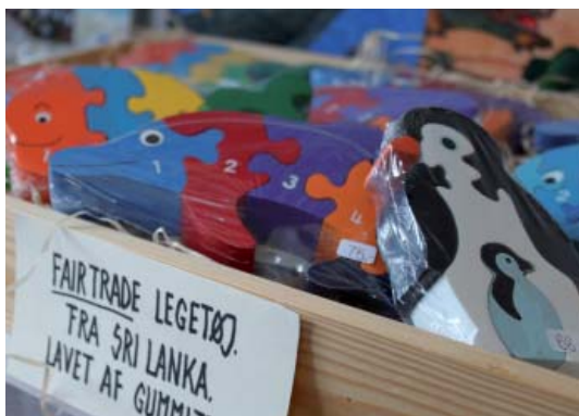
Fairtrade legetøj sælges i butikken

Vi bestræber os i butiksudvalget på at udvide sortimentet med kvalitetsvarer og ønsker os flere lokalt fremstillede varer, også gerne kunsthåndværk. Vi vil selvfølgelig gerne have så mange kunder som muligt i vores lille butik – i den sidste ende drejer det sig jo om at tjene penge til driften af vores allesammens Bovbjerg Fyr, så vi kan bevare stedet og give os alle mange flere gode oplevelser.